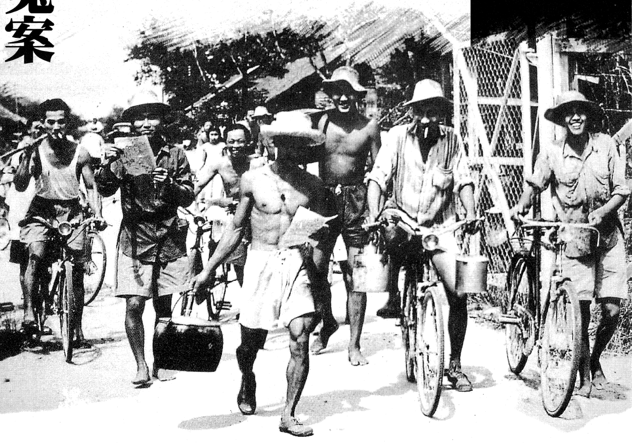
01. 1993年，大马警方画出双溪乐莫胶园宿舍的模拟图。

我的心愿？希望这案件快快了断咯，我等不了太久，今天不知明天事，走在路上也可能给车撞死，对不对？