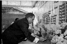
▲英国高等法庭宣判峇冬加里惨案裁决后，英政府代表首次出席纪念惨案的64周年追悼大会，图为英驻马最高专员石羽向列着24名罹难者名字的横幅鞠躬与献花。